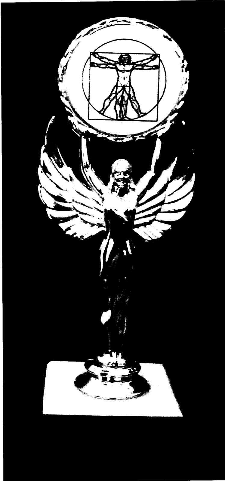
Opis: W wierszu pierwszym LEONARDO, w drugim Najlepszy (nazwa kategorii), w trzecim określenie roku szkolnego np. 2007/2008.