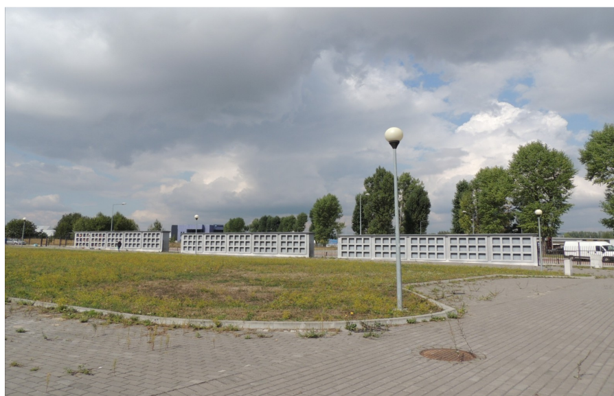
Budowa nowego cmentarza komunalnego przy ulicy Objazdowej