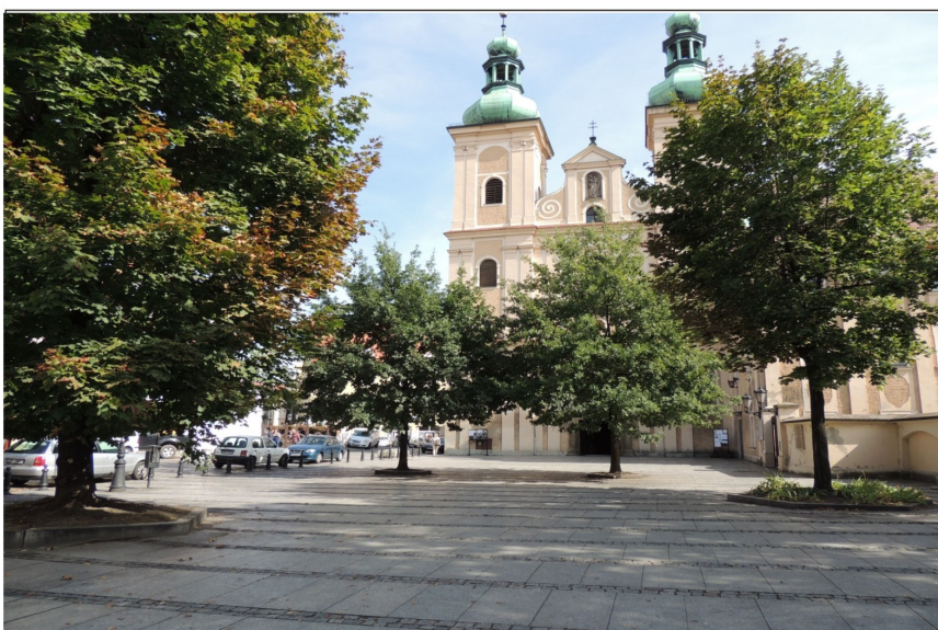
Renowacja po klęsce powodzi placu Franciszkańskiego