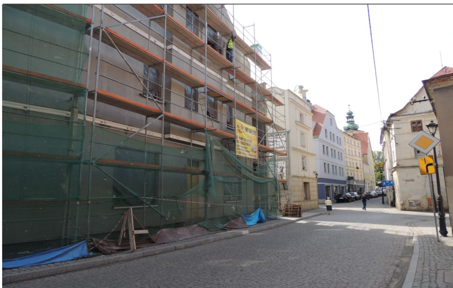
Nowa zabudowa plombowa przy ulicy J.Matejki