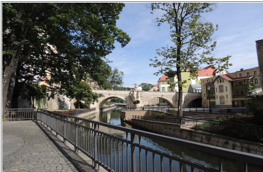
Rejon parku Sybiraków