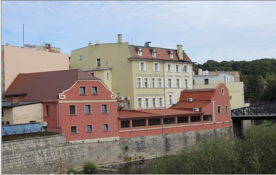
Renowacja po klęsce powodzi zabudowy w rejonie ulicy A.Grottgera