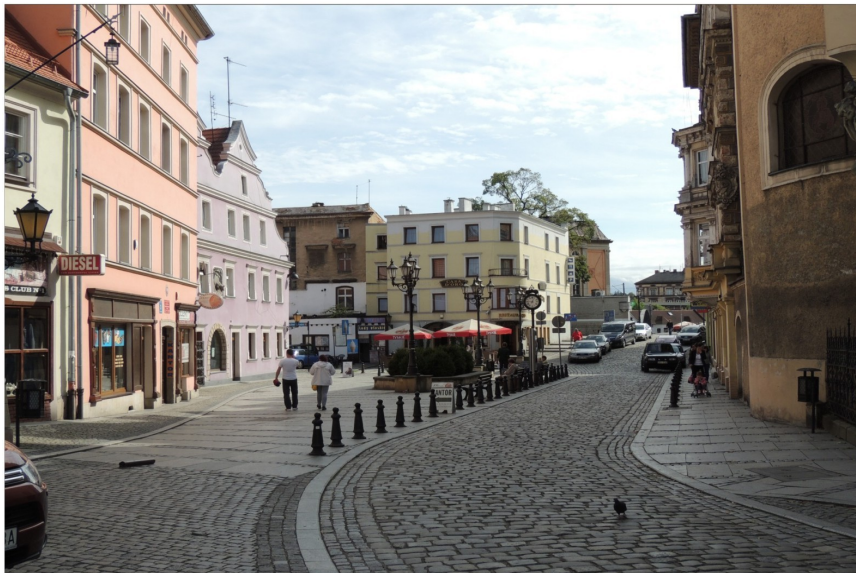
Renowacja po klęsce powodzi zabudowy przy ul. A. Grottgera