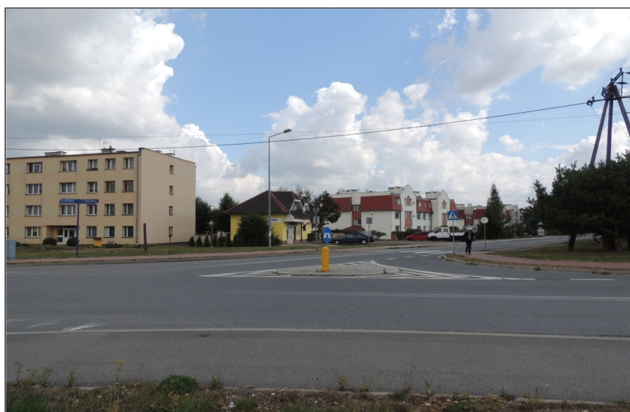
Skrzyżowanie ulic: Objazdowej z ulicą Korytowską i ulicą Zajęczą