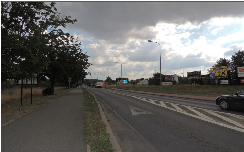
Odcinek ulicy Noworudzkiej