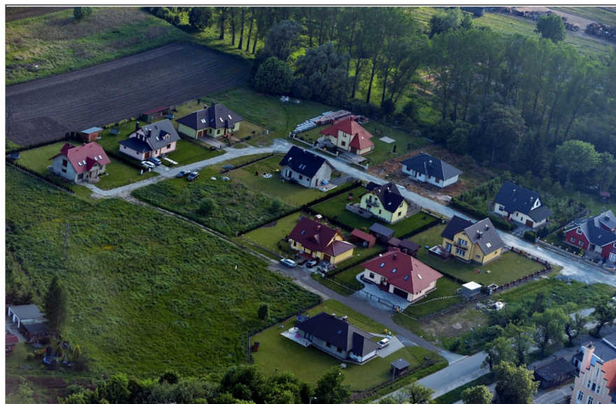
Realizacja zabudowy mieszkaniowej jednorodzinnej w rejonie ul. Zamiejskiej