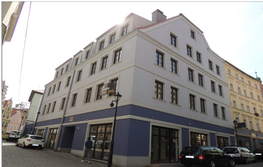
Nowa zabudowa plombowa u zbiegu ulicy J. Matejki i ulicy Braci Gierymskich