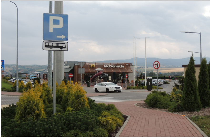
Bar McDonald's w sąsiedztwie galerii handlowej „Twierdza Kłodzka”