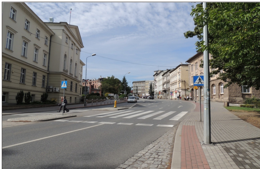
ul. T. Kościuszki w rejonie Starostwa Powiatowego