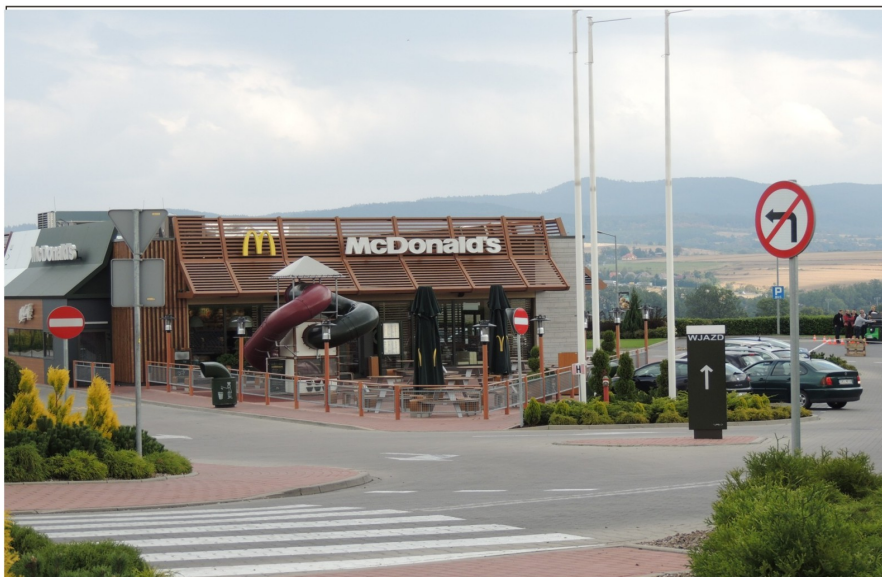
Bar McDonald's w sąsiedztwie galerii handlowej „Twierdza Kłodzka”