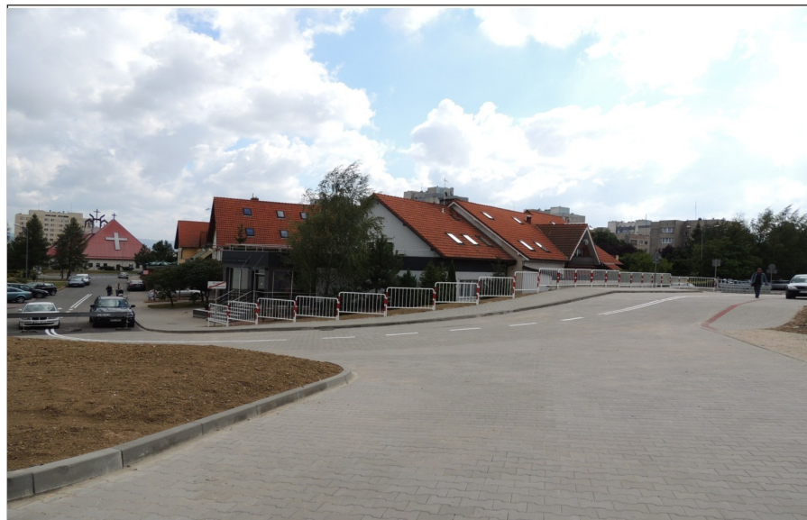
Połączenie ulicy Wiosennej z ulicą Spółdzielczą