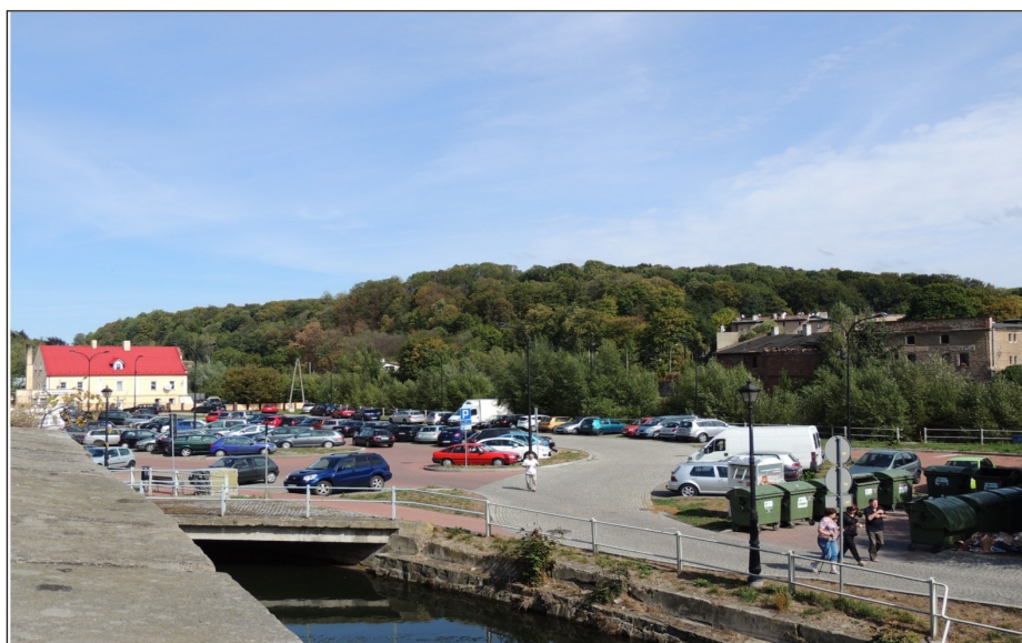
Parking samochodowy przy ulicy Z.Stryjeńskiej