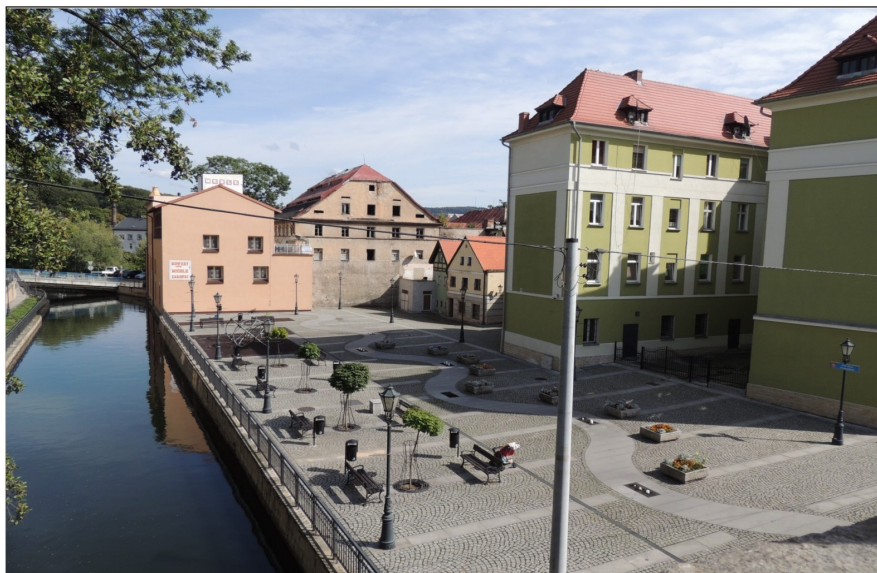
Zaplecze zabudowy przy ulicy J. Matejki