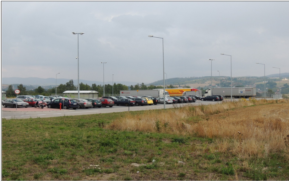
Poszerzenie parkingu samochodowego w Galerii „Twierdza Kłodzko”