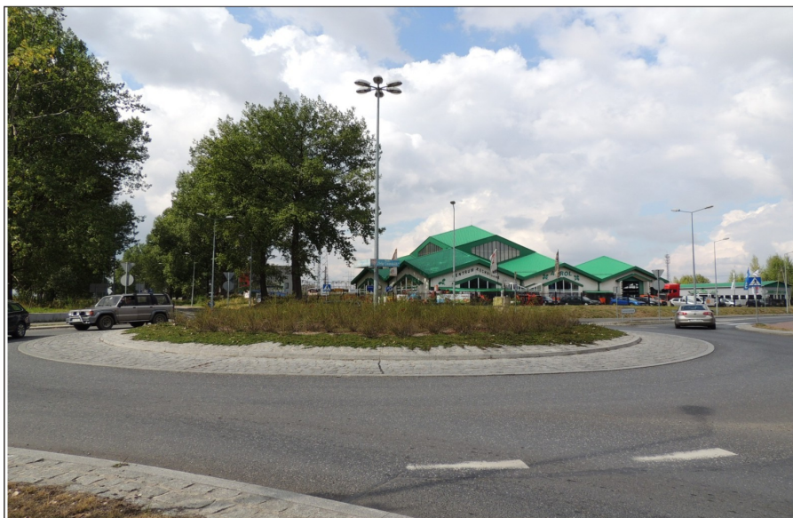
Rondo Orłąt Lwowskich na skrzyżowaniu ulicy Objazdowej z ulicą Dusznicką