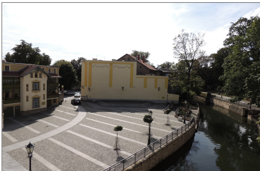
Teren kina letniego na zapleczu ulicy S. Daszyńskiego