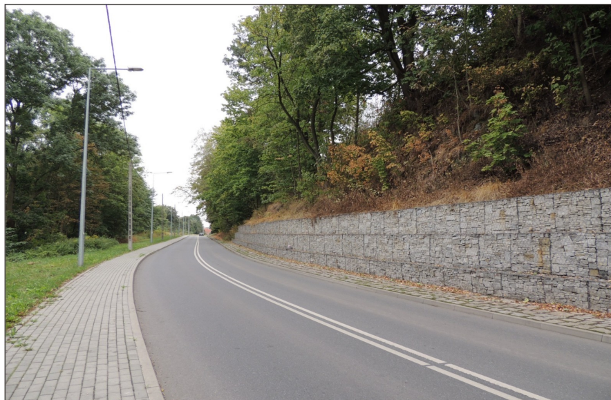
Odcinek ulicy Nadrzecznej