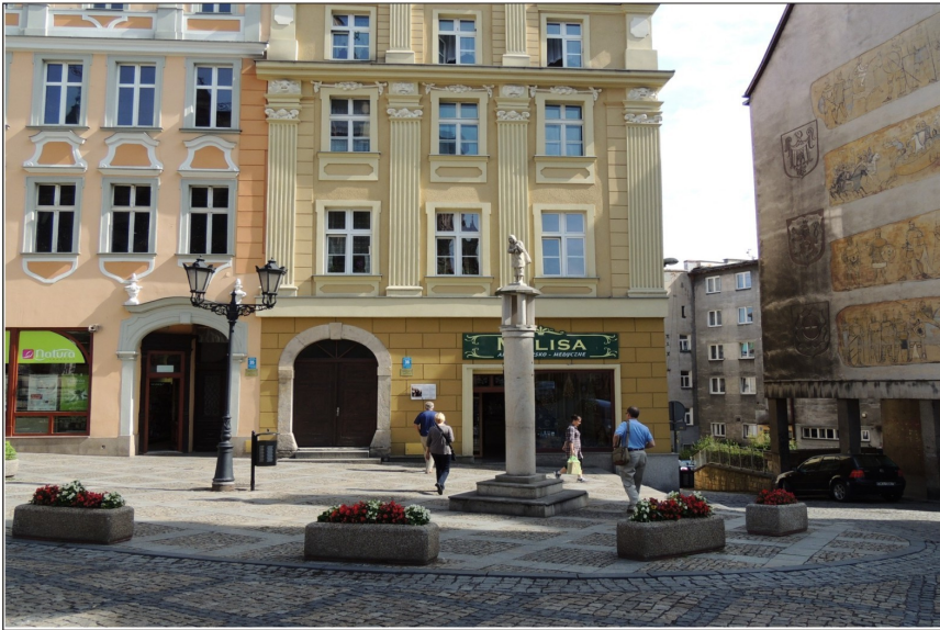
Pręgieryz na placu Bolesława Chrobrego