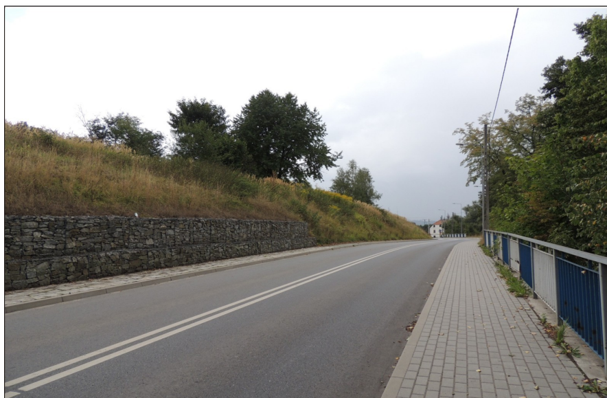
Odcinek ulicy Nadrzecznej