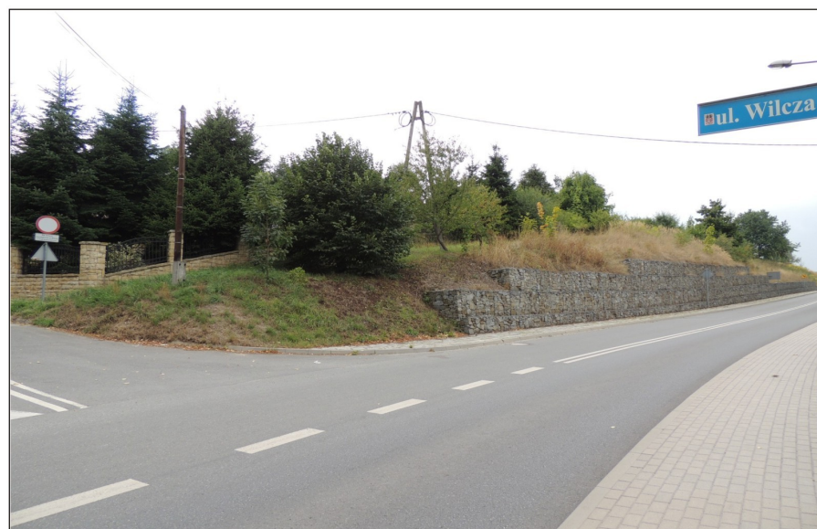
Skrzyżowanie ulicy Nadrzecznej z ulicą Wilczą