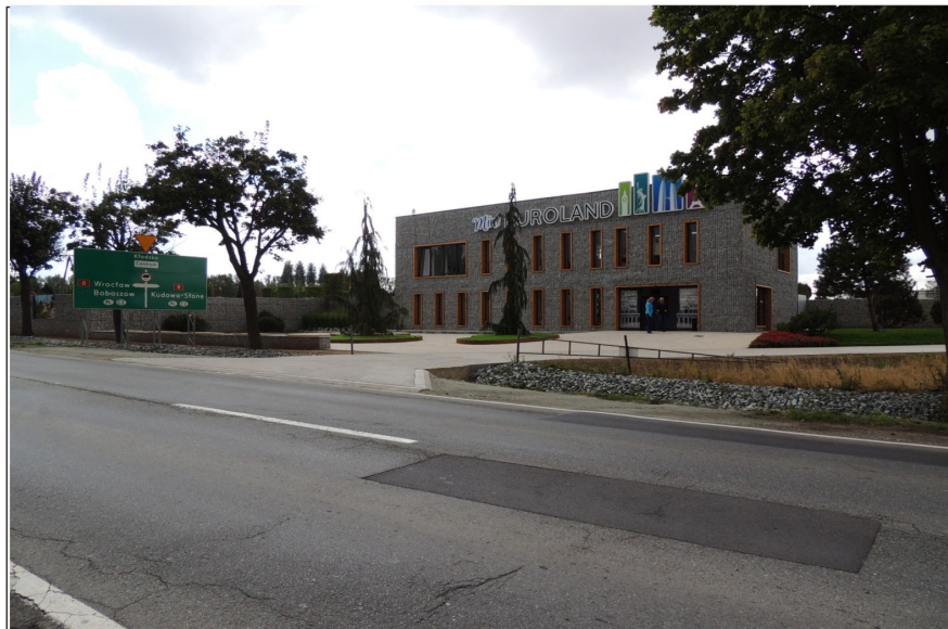
„Mini Euroland” przy ulicy Noworudzkiej