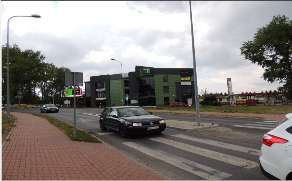
Odcinek ulicy Objazdowej przy Rondzie Wileńskim