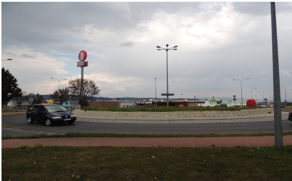
Rondo Wileńskie na skrzyżowaniu ul.Objazdowej z ul.Noworudzką