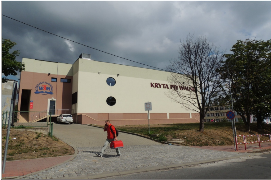
Zespół krytej pływalni przy ulicy Jana Pawła II