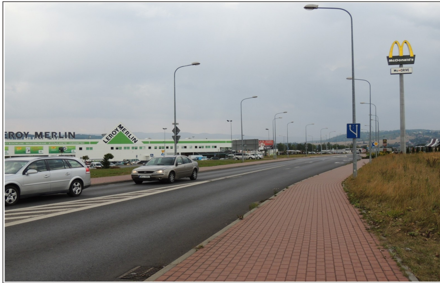
Droga dojazdowa prowadząca z Ronda Wileńskiego do galerii Twierdza Kłodzka