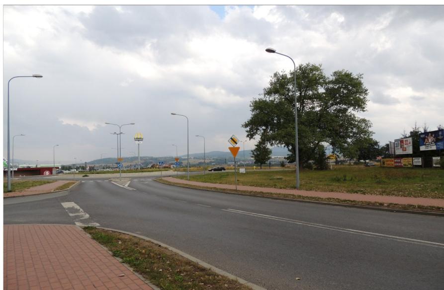
Odcinek ulicy Objazdowej przy Rondzie Wileńskim