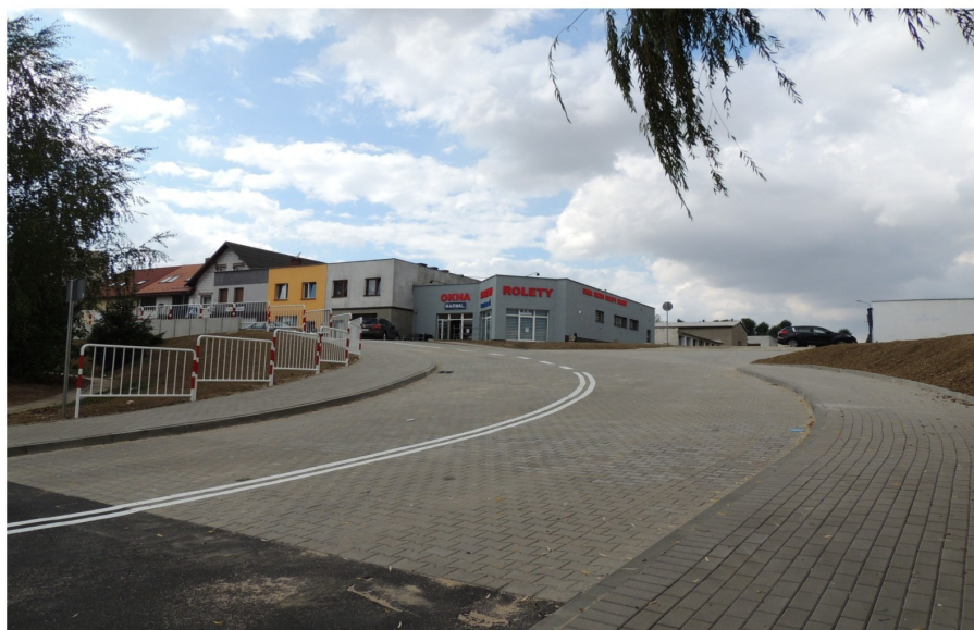
Połączenie ulicy Wiosennej z ulicą Spółdzielczą