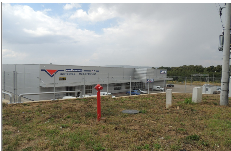
Hurtownia motoryzacyjna u zbiegu ul. J. Piłsudskiego i ul. Warty