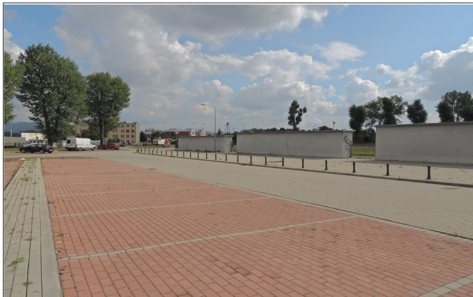
Parking samochodowy przy nowym cmentarzu komunalnym przy ulicy Objazdowej