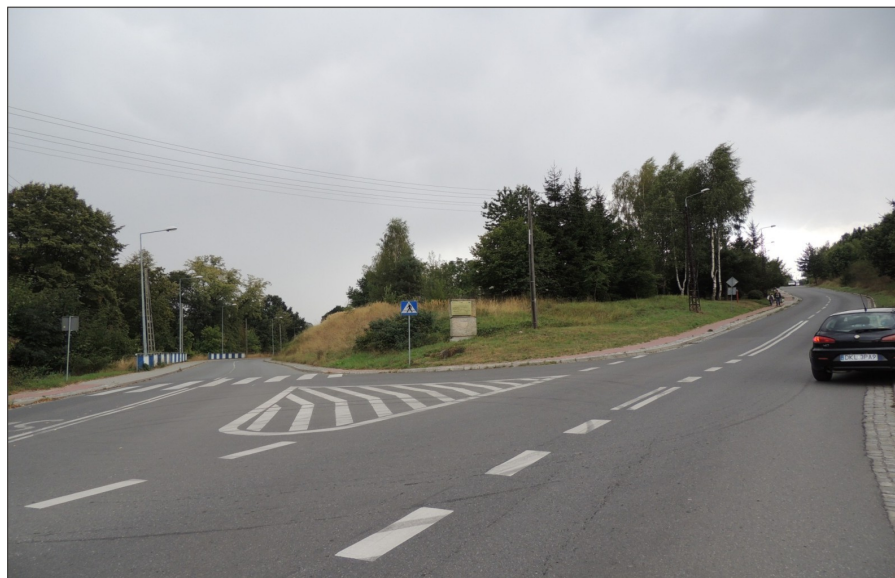
Skrzyżowanie ulicy Nadrzecznej z ulicą Nowy Świat