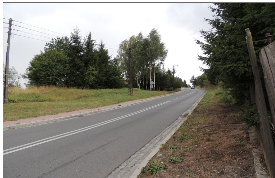
Odcinek ulicy Nowy Świat