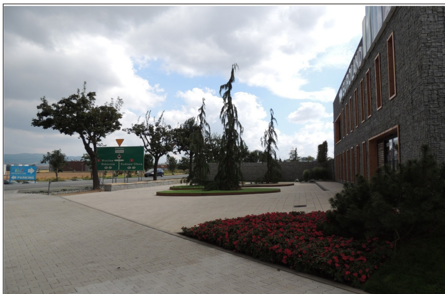
„Mini Euroland” przy ulicy Noworudzkiej