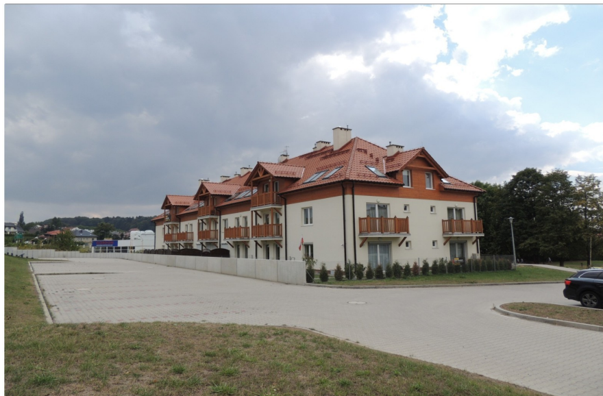
Nowy wielorodzinny budynek mieszkalny przy ulicy Zamiejskiej