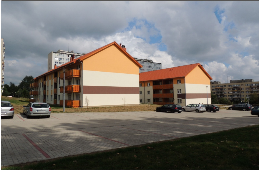
Nowe wielorodzinne budynki mieszkalne w obrębie osiedla im. L. Kruczkowskiego