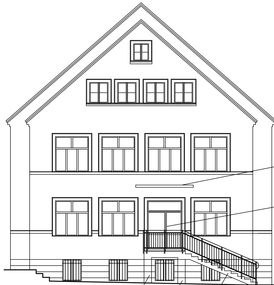
Elewacja wschodnia (boczna).