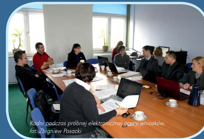
Radni podczas próbnej elektronicznej oceny wniosków

Od najbliższego naboru wniosków z programu Leader Rada Lokalnej Grupy Działania będzie dokonywać ich oceny poprzez elektroniczny system. Pozwala on na ocenę wniosków z pozycji przeglądarki internetowej pod wcześniejszym zalogowaniem się. Dzięki temu ocena wniosków będzie nie tylko sprawniejsza, ale zaoszczędzi również konieczność drukowania wielu dokumentów. Jak każda nowość, musi jednak zostać przetestowana, dlatego też Rada zebrała się, żeby dokonać próbnej oceny i wnieść ewentualne uwagi do pracy systemu.