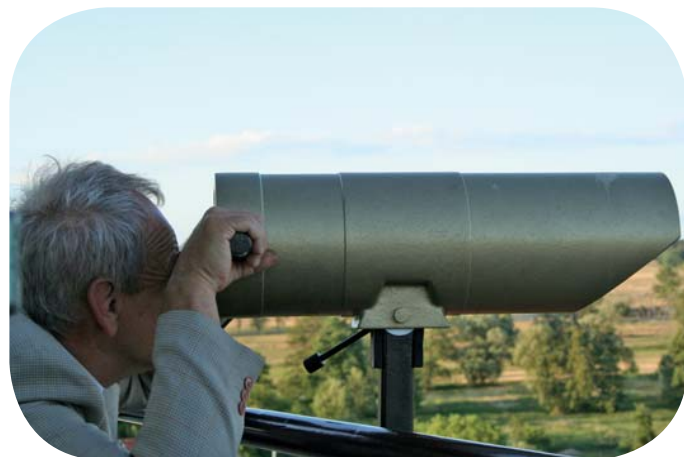
Z możliwości spojrzenia na okolicę przez lunetę korzystali licznie uczestnicy Pikniku na Zamku w czerwcu 2011

Stąd pomysł, aby aplikować o środki UE w ramach „małych projektów” osi Leader jako jeden z elementów wdrażania Lokalnej Strategii Rozwoju Krainy Łęgów Odrzańskich. Dotacja wyniosła prawie 24 tys. zł, czyli 70% kosztów kwalifikowanych zadania. Prace remontowe dotyczyły wymiany balustrady, montażu barierki ochronnej, wymiany okien i drzwi wieży oraz zakupu 2 lunet widokowych. Efekt prac na pewno zadowoli wielu – został podniesiony nie tylko komfort, ale także bezpieczeństwo korzystania z wieży, a lunety pozwalają w pełni cieszyć się wspaniałym widokiem. A Zamek Piastowski znów zyskał na swojej atrakcyjności.