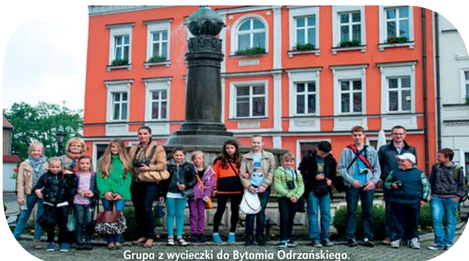
Grupa z wycieczki do Bytomia Odrzańskiego.

Gminny Ośrodek Kultury w Białogórze realizuje projekt „Magia Fotografii”, w ramach którego uczestnicy poznali zasady działania aparatu fotograficznego, nauczyli się robić zdjęcia studyjne, wybrali się na trasę biegu „Polska Biega”, aby obcy się z fotografią sportową.