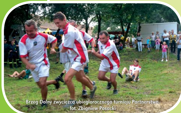
Brzeg Dolny zwycięzcą ubiegłorocznego turnieju Partnerstwa

Miejsce: Boisko w Miękini Więcej na www.kultura.miekini.pl oraz www.lgdodra.pl