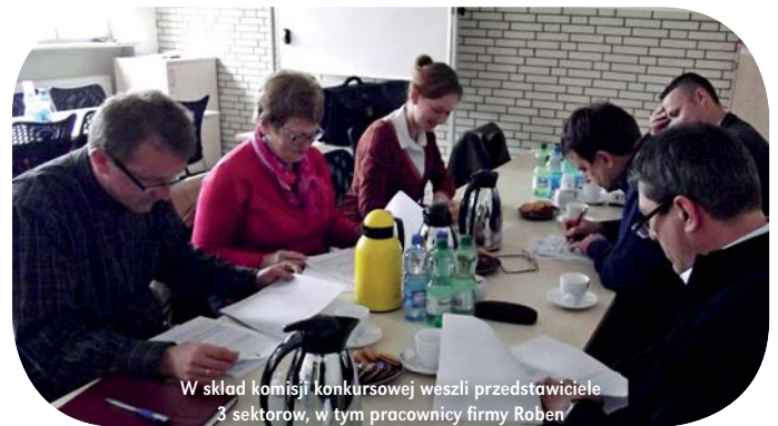
W skład komisji konkursowej weszli przedstawiciele 3 sektorów, w tym pracownicy firmy Röben

Zwycięzców drugiej edycji programu „Mała Architektura, Duża Sprawa”, który wspiera najciekawsze projekty budowy, remontów i adaptacji obiektów służących mieszkańcom Krainy Łęgów Odrzańskich, wyłoniła 4 czerwca komisja konkursowa. W jej skład weszli przedstawiciele trzech sektorów: społecznego, publicznego oraz gospodarczego. Największe uznanie komisji wzbudził projekt pieca chlebowego wraz z grillem „Święto plonów i chleba”, opracowany przez Stowarzyszenie „Aktywne Sołectwo Węgrzce-Wrzeszów”. Tuż za nim uplasował się projekt wiaty autorstwa Stowarzyszenia „Borek Wieś Naszych Marzeń”, zatytułowany „Chwila relaksu w Borku”. Trzecie miejsce zdobył plan „Rozbudowa infrastruktury turystycznej nad Odrą poprzez budowę grilla”, przygotowany przez Ochotniczą Straż Pożarną w Ścinawie. Laureaci otrzymają od firmy Röben materiały budowlane potrzebne do realizacji projektów, o łącznej wartości 15 000 zł.