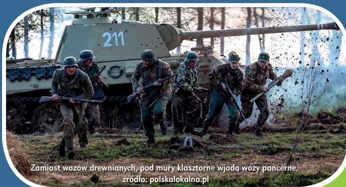
Zamiast wozów drewnianych, pod mury klasztorne wjadą wozy pancerne.