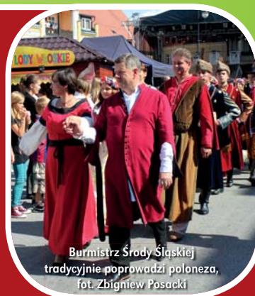
Burmistrz Środy Śląskiej tradycyjnie poprowadzi poloneza