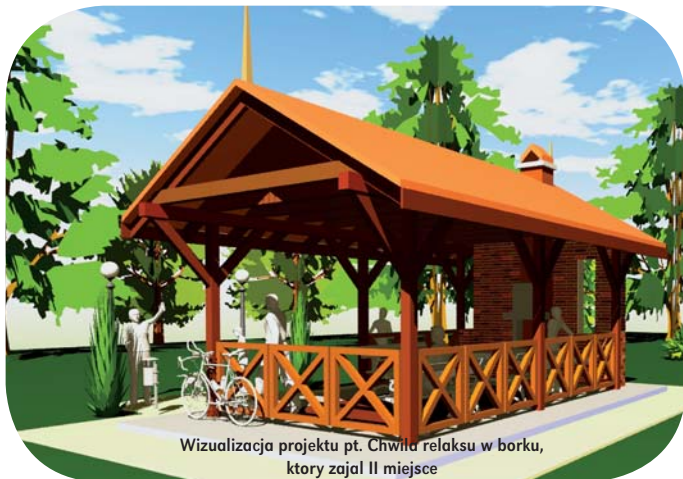
Wizualizacja projektu pt. Chwila relaksu w borku, który zajął II miejsce