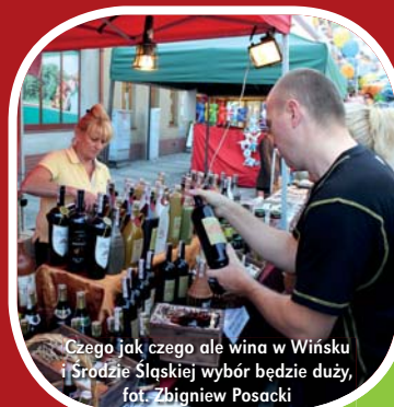
Czego jak czego ale wina w Wińsku i Środzie Śląskiej wybór będzie duży