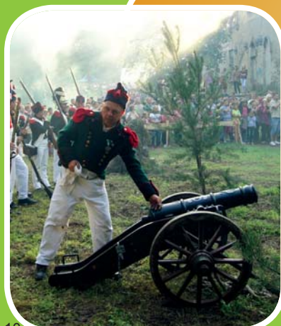
Armatnie wystrzeliły znów zabrzmia pod prochowickim zamkiem, fot. Anna Linda

Miejsce: Zamek w Prochowicach Więcej na: www.pokis.com.pl