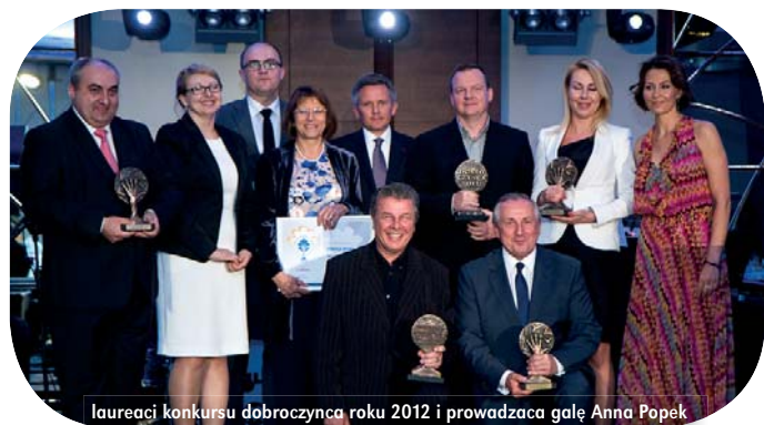
laureaci konkursu dobroczyńca roku 2012 i prowadząca galę Anna Popek

„Dobroczyńca Roku” to największa i najstarsza w Polsce inicjatywa nagradzająca i promująca społeczne zaangażowanie firm. W tym roku wyróżnienia przyznano już po raz szesnasty. Gala Finałowa, która odbyła się 20 maja 2013 w Warszawie, została objęta Honorowym Patronatem Prezydenta Rzeczypospolitej Polskiej Bronisława Komorowskiego oraz Małżonki Prezydenta Anny Komorowskiej.