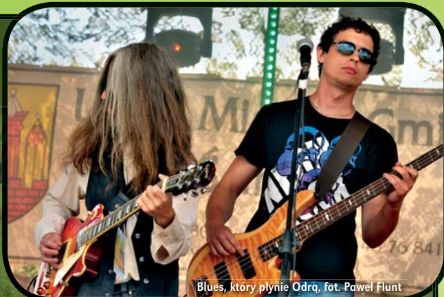
Blues, który płynie Odrą

Miejsce: Port Ścinawa Więcej na: www.bluesnadodra.pl