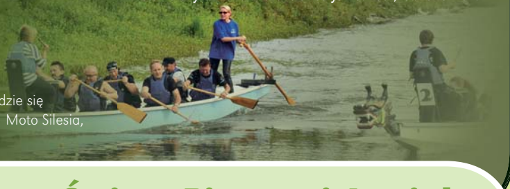
Zlotowicze rywalizowali m.in. na smoczych łodziach