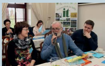
fol. R. Plezia

wyszkolonych 71 osób z zakresu obsługi ruchu turystycznego i promocji turystycznej obszaru partnerów.