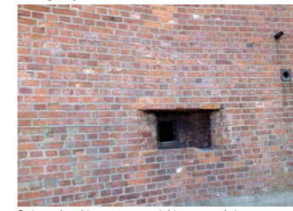
Bojowy bunkier ze stanowiskiem strzelniczym.