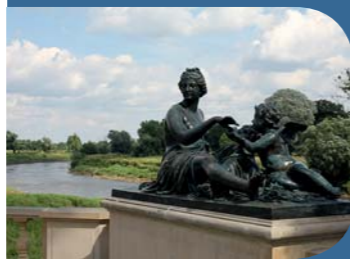
fol. Z. Posacki