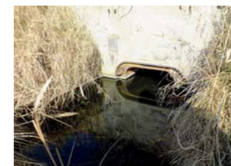
Zalane wejście do bunkra.