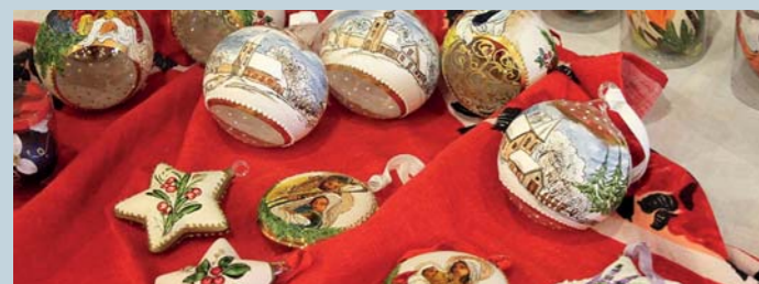
fol. A. Peregrym

W trzeciej części spotkania omówiono zagadnienia związane z organizacją Festiwalu Rękodziela – imprezy o charakterze promującym i integrującym środowisko rękodzielników z tereny Krainy Łęgów Odrzańskich. Uczestnicy zadeklarowali chęć dalszej współpracy z LGD KŁO oraz podejmowania wysiłku nad budowaniem wspólnej marki produktów lokalnych. Pierwsze Forum Rękodzielnicze w Ścinawie ukazało ogromny potencjał – życzymy sobie, aby został on należycie wykorzystany i zaprezentowany podczas planowanego Festiwalu.