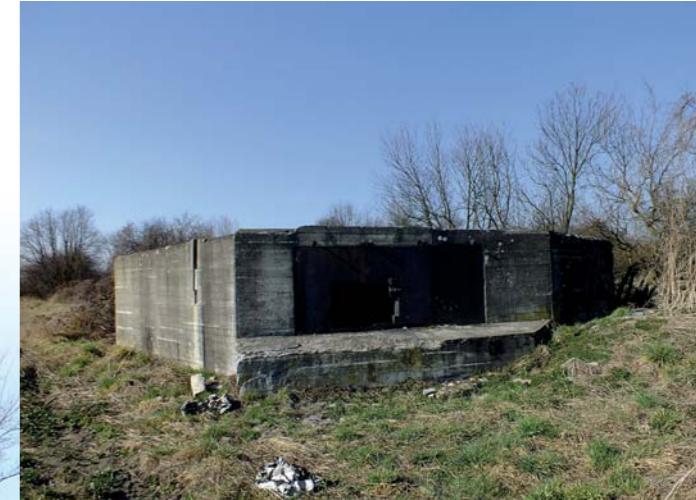
Bunkier z boku.