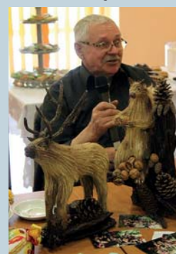
fol. A. Peregrym

W Centrum Turystyki i Kultury w Ścinawie w dniu 8 kwietnia odbyło się Forum Rękodzielnicze, którego organizatorem było Stowarzyszenie Lokalna Grupa Działania „Kraina Łęgów Odrzańskich”. Wzięło w nim udział 26 rękodzielników z Krainy Łęgów Odrzańskich.