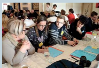
fol. R. Plezia