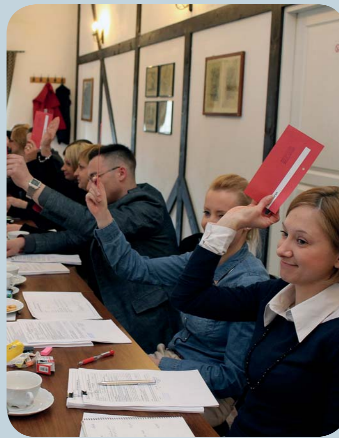
fol. Z. Posacki

Ostateczne listy rankingowe wniosków są dostępne na stronie www.lgdodra.pl w zakładce Leader.