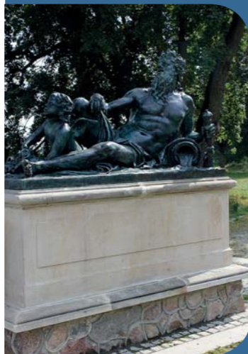
fol. Z. Posacki