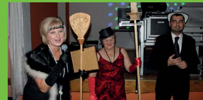
fol. A. Peregrym