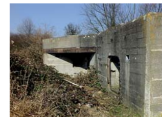
Bunkier z podwójnym wejściem i stanowiskiem obrony wejścia.