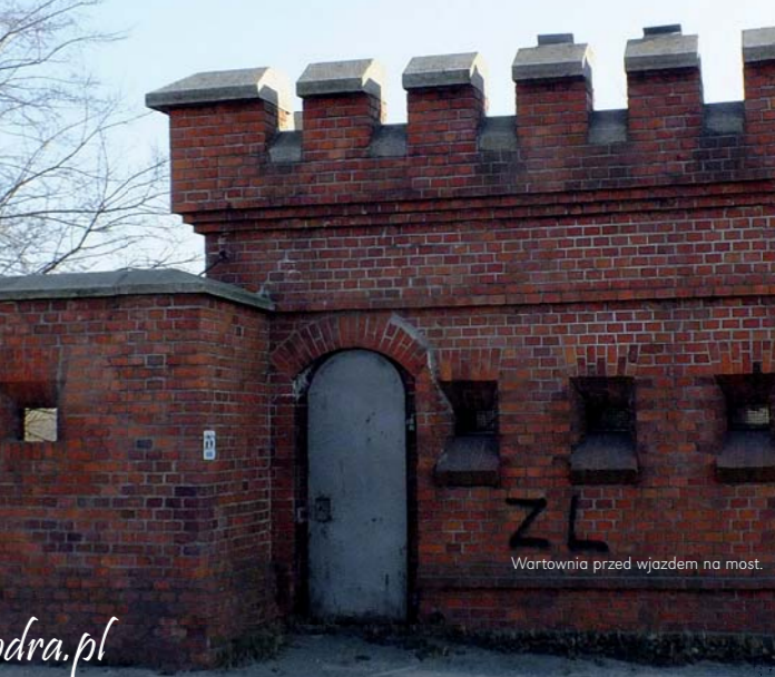
Wartownia przed wjazdem na most.