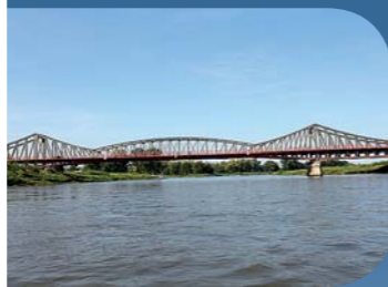
fol. Z. Posacki