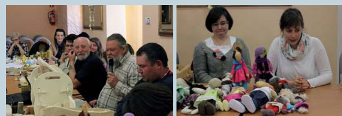
fol. A. Peregrym

W drugiej części Forum przystąpiono do dyskusji na temat metod, sposobów i narzędzi wzmocnienia własnego kapitału. Wśród zaproponowanych rozwiązań kładziono naciska na wspólne działania pod jednym szyldem oraz zwiększanie dostępności do informacji wewnątrz grupy, jaki i na zewnątrz – reklama, informowanie klientów, zmianę świadomości potencjalnych odbiorców.