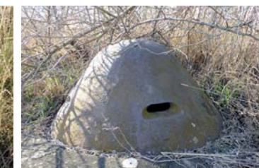
Schron z kopułką obserwacyjną.