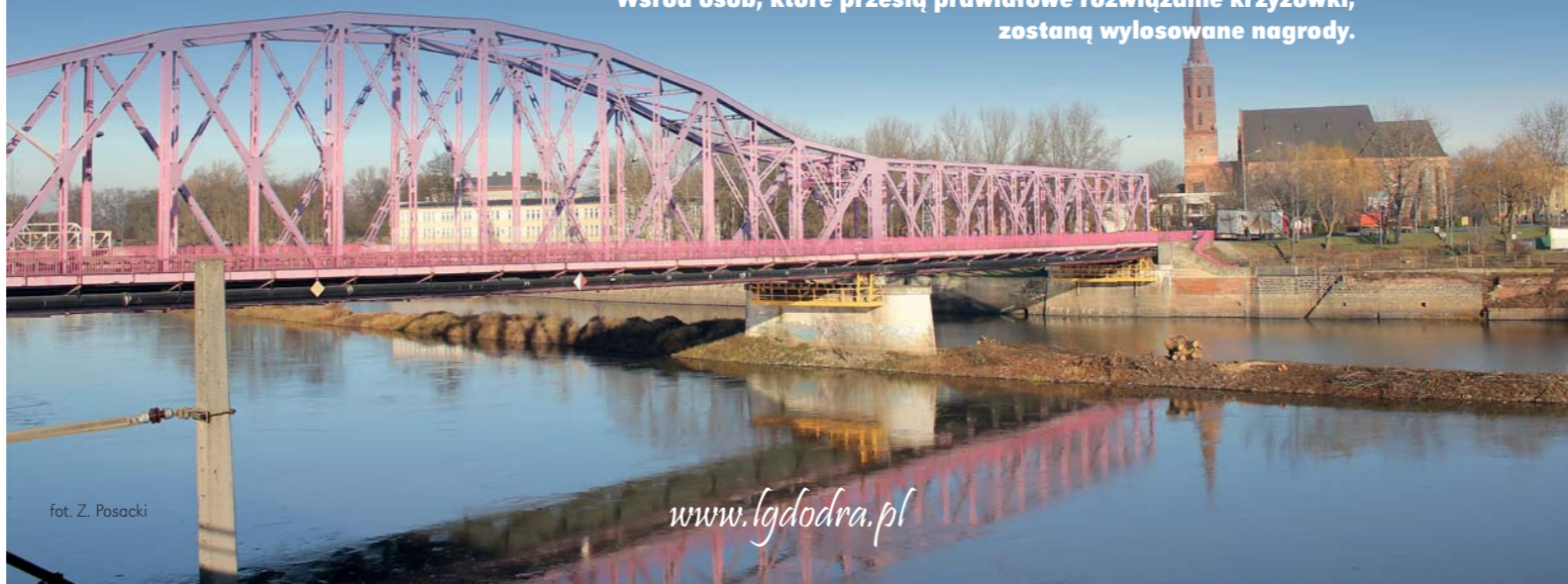
fol. Z. Posacki