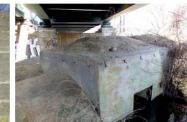
Bunkier pod mostem.