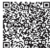
Sklep Google Play